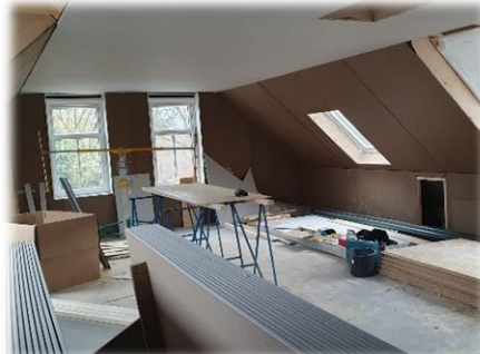
Grote zaal (boven)