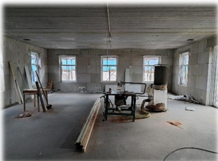
Grote zaal (beneden)