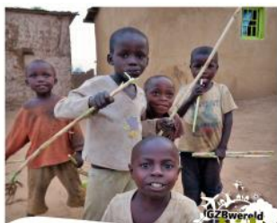
Wereldkids Rwanda 'Geef het door'

In dit leuke programma vind je allerlei activiteiten om samen met kinderen bezig te zijn met zending. Leuk om te doen op bijvoorbeeld